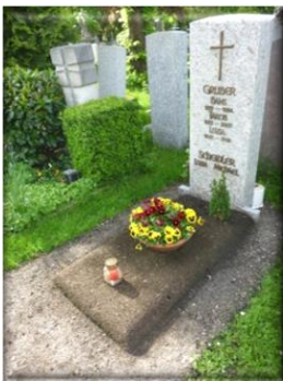
* provisorische Erstanlage