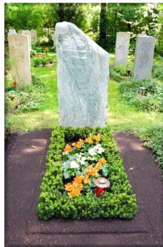
Beispiel einer Neuanlage

Wir bieten neben einem individuellen Leistungsumfang eine regelmäßige Überprüfung der Pflegeleistungen vor Ort. So können Sie sicher sein, dass die von Ihnen vereinbarten Leistungen wunschgemäß von unseren Vertragsgärtnern erbracht werden. Zum anderen können wir bei Betriebsaufgabe eines Gärtnereibetriebes umgehend die Pflege durch einen anderen Gärtnereibetrieb fortführen lassen, ohne dass es zu einer Beeinträchtigung der Pflege kommt.